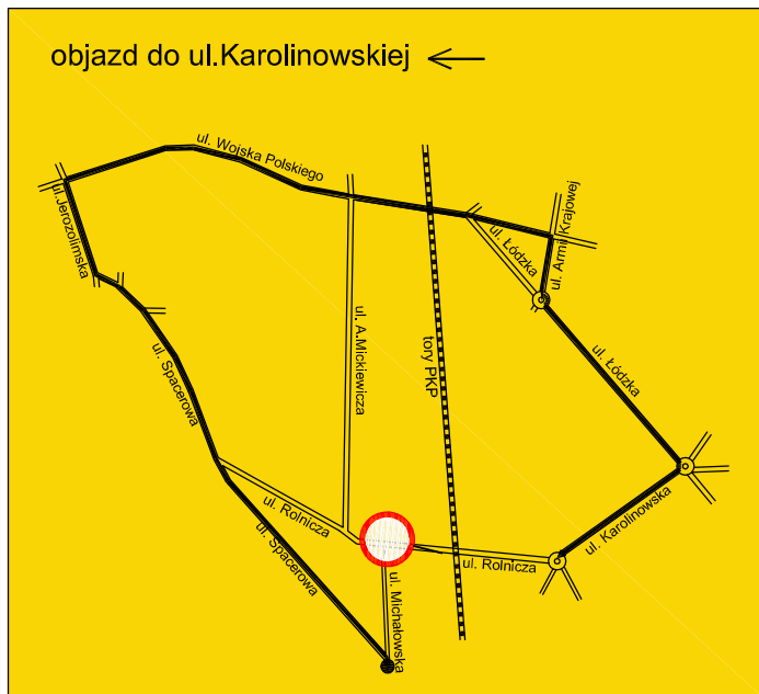
tablica (3) F-8 1szt.